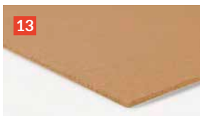
GUTEX Happy Step® Die vernünftige Basis für hochwertige Bodenbeläge