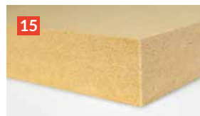
GUTEX Thermowall®-L Die leichte Putzträgerplatte für vollflächige Untergründe