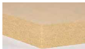
GUTEX Pyroresist® wall Die erste schwer entflammbare und zugleich nicht glimmende Holzfaserdämmplatte für die Fassadendämmung im mehrgeschossigen Wohnungsbau.