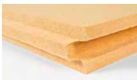
GUTEX Thermowall® Durio Die Spezialplatte für Putzfassade und hinterlüftete Holzfassade mit einschichtigem homogenen Rohdichtprofil im Fassadendämm-System GUTEX Durio®.