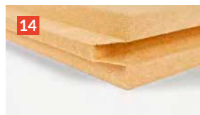
GUTEX Thermowall®/-gf /NF Die ideale Putzträgerplatte mit einschichtigem homogenen Rohdichtprofil für das ökologische GUTEX Wärmedämmverbundsystem